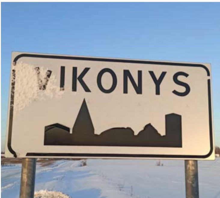
Anykščių seniūnijos Vikonių kaimo gyventojai vandens neturėjo visą savaitę. Dabar vanduo jau tiekiamas.

Robertas ALEKSIEJŪNAS robertas.a@anyksta.lt