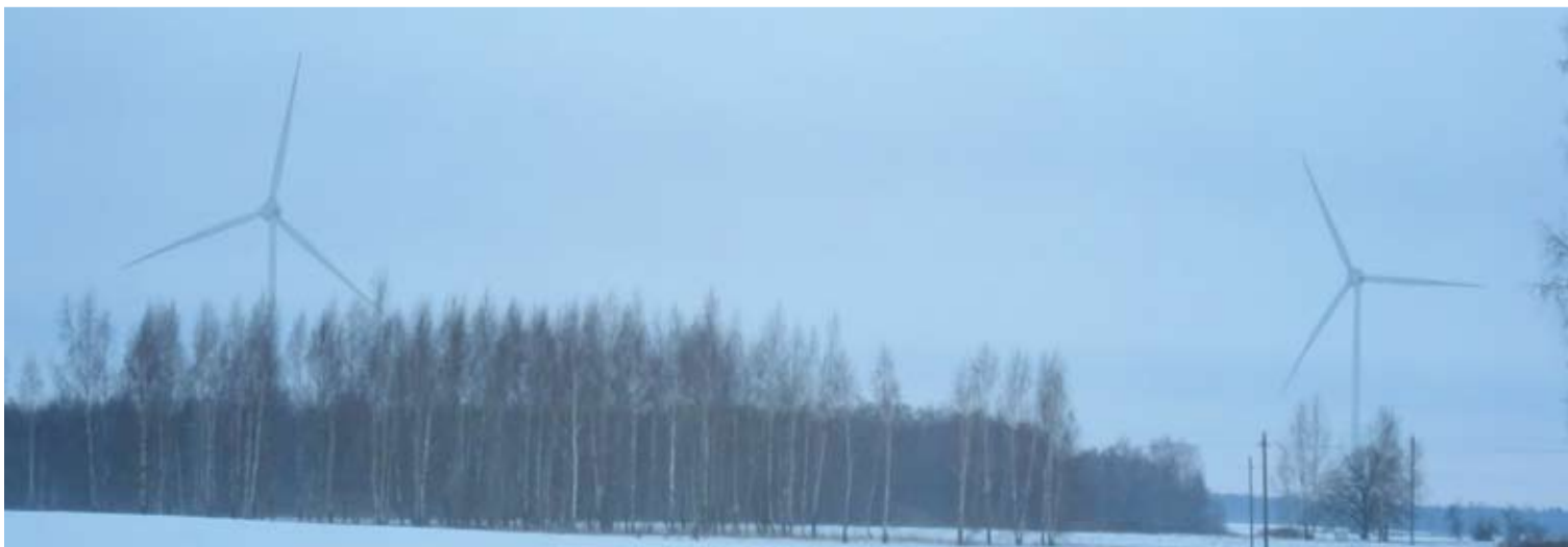
Kavarsko seniūnijoje, šalia kelio Kavarskas-Taujėnai, jau sukasi dvi vėjo elektrinės.

Budrių bendruomenė jau yra išsiuntusi raštus Anykščių rajono savivaldybės administracijai bei planuojamos vėjo jėgainių ūkinės veiklos organizatoriui UAB „Aušrinis“, poveikio aplinkai vertinimo dokumentų rengėjui – UAB „Archstudija“.