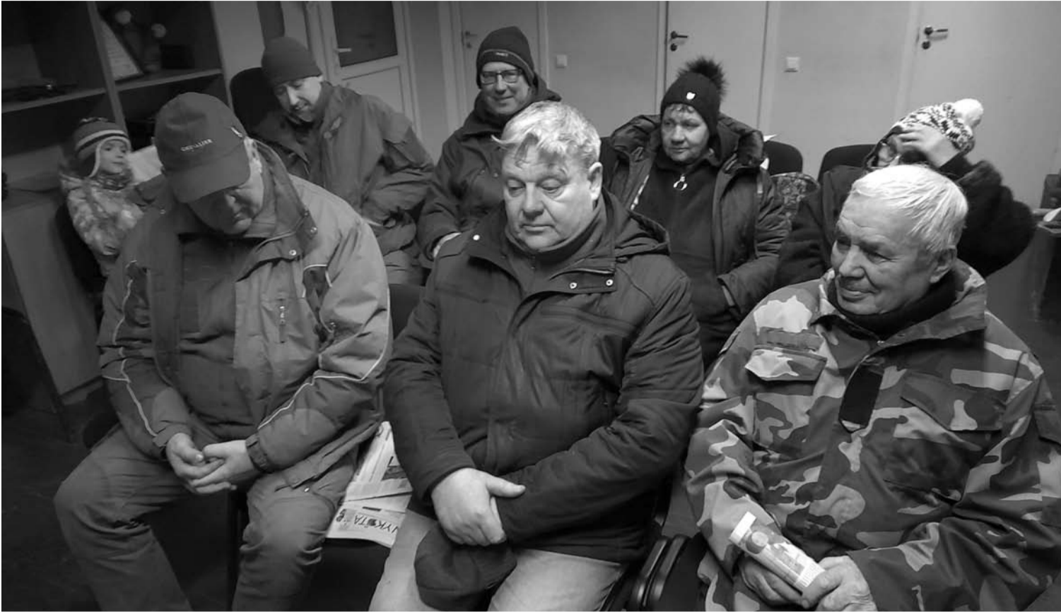
Po susirinkimo aktyviausieji Budrių bendruomenės nariai dar liko padiskutuoti – išsakyti savo priešingąsi vėjo jėgainių statyboms.