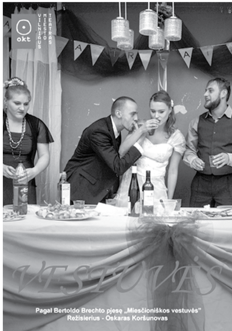
Pagal Bertoldo Brechto pjesę „Miesčioniškos vestuvės“ Režisierius - Oskaras Karšunovas